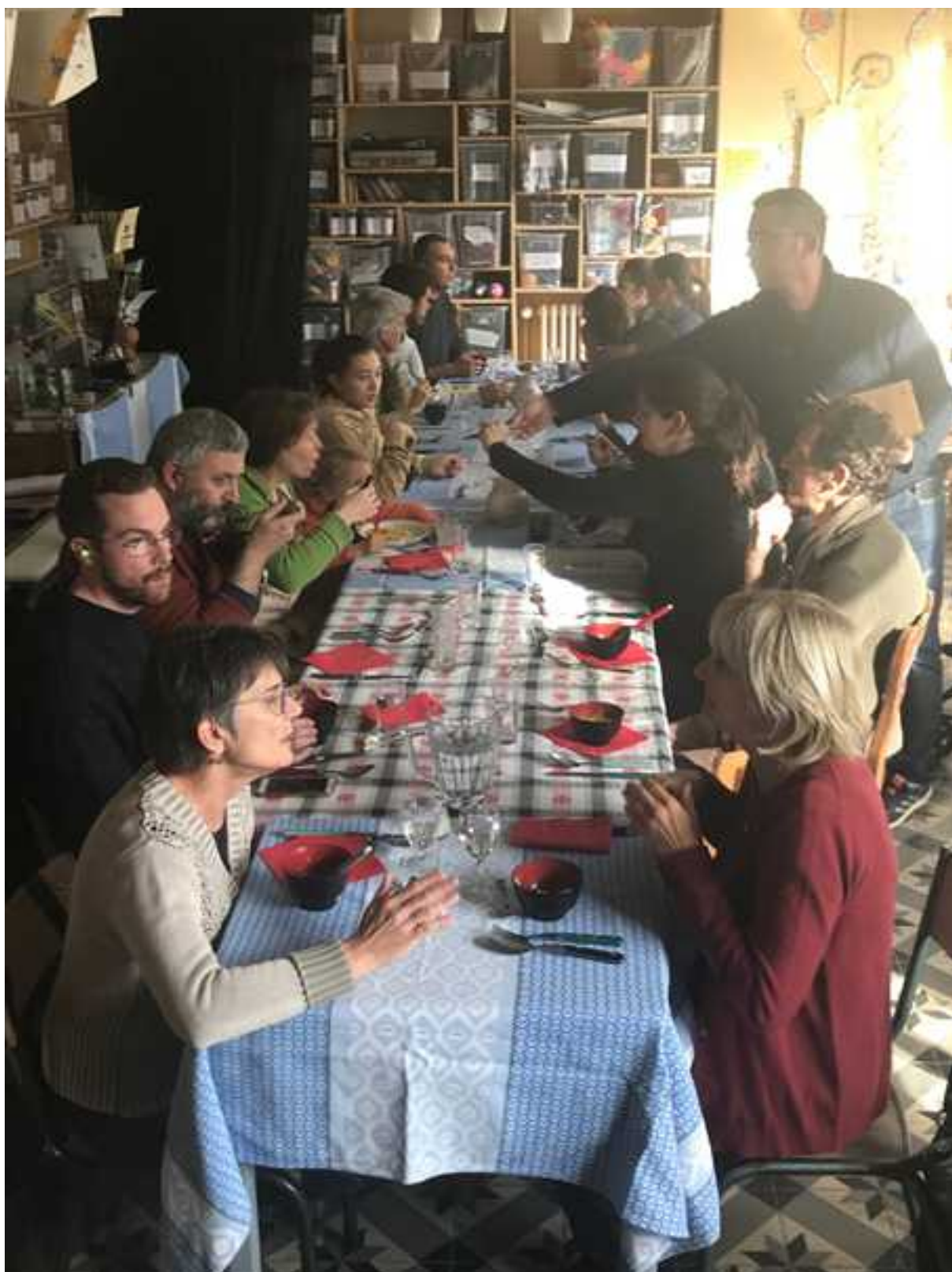
L'association Zéro déchet a invité le café des pratiques à intervenir dans ses locaux de l'Arsenal. Le café a offert ce repas à tous ceux qui s'étaient inscrits à cette action.