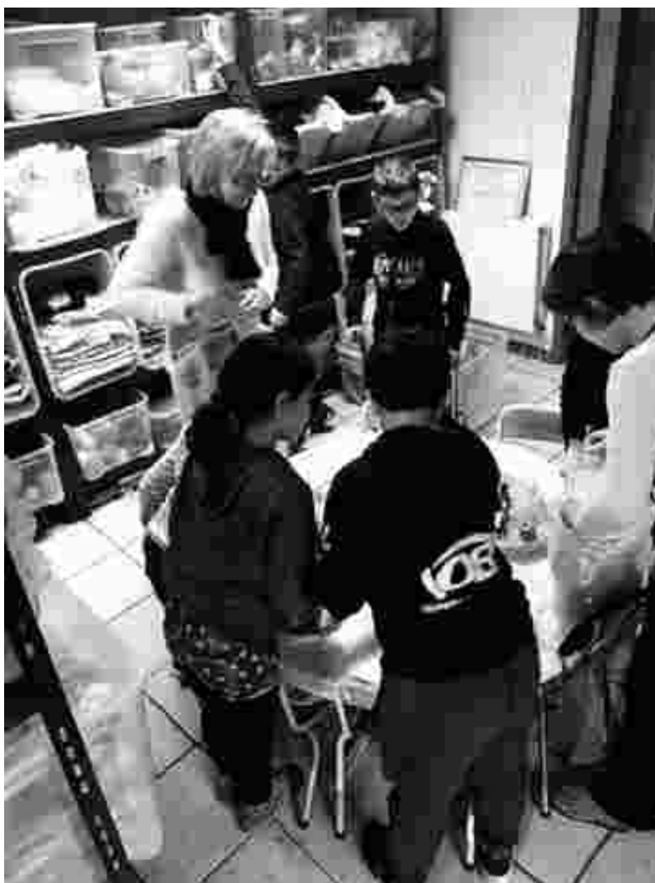
Recherche de ressources à la base des pratiques

La base des pratiques, ouverte depuis septembre 2016 met en lien des personnes intéressées par l'art et la création. Cet espace accueille aussi des personnes isolées, pour qui le don est une façon d'être en relation. Des habitants du quartier, n'ayant pas osé pénétrer au café, sont venus dans ce nouvel espace. Les enfants passent du temps à la base des pratiques et développent leur créativité au travers de l'utilisation des ressources.