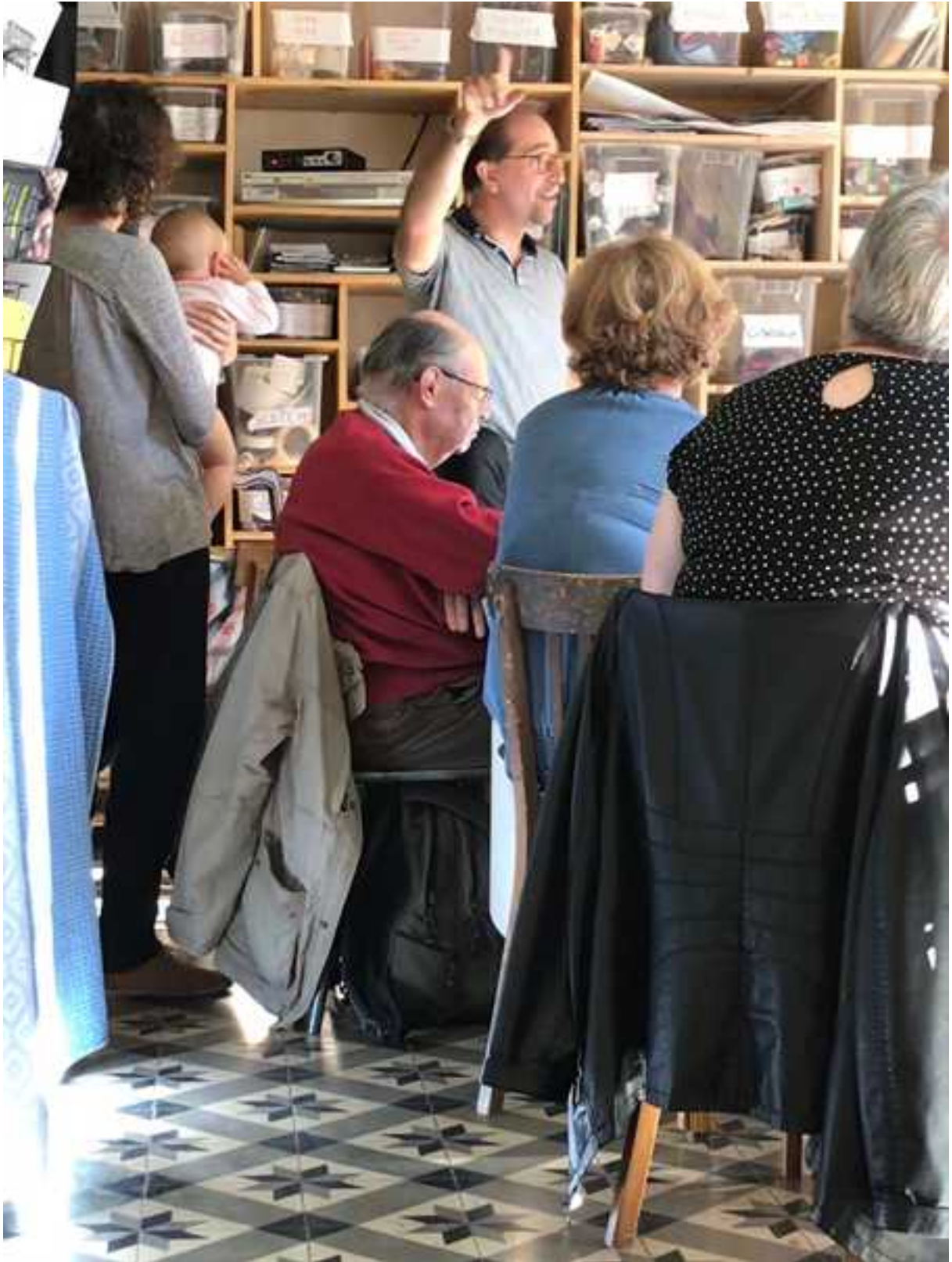
Petites dégustations musicales