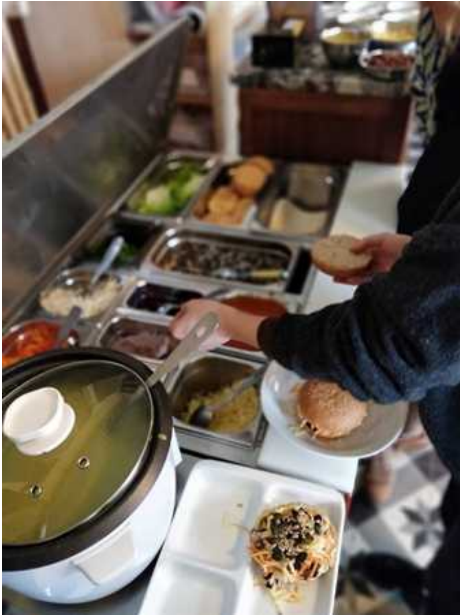
La saladette, un outil au service de l'autonomie

Les repas, collations ainsi que les ressources pour les activités sont en libre service. Cette évolution, en phase avec les valeurs associatives de prise d'initiative et d'implication de chacun, permet à l'association de réduire le nombre de personnes au service : chacun y participe !