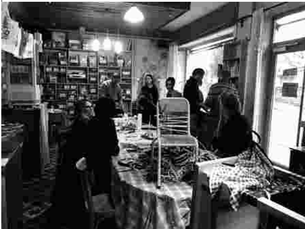
Une séance de formation de l'école des pratiques

Ainsi, on dénombre en moyenne 56 heures d'ouverture par semaine et avec la préparation à l'ouverture et aux ateliers, ainsi que l'entretien des locaux, on arrive en moyenne à 67 heures de présence nécessaires sur le lieu de travail.