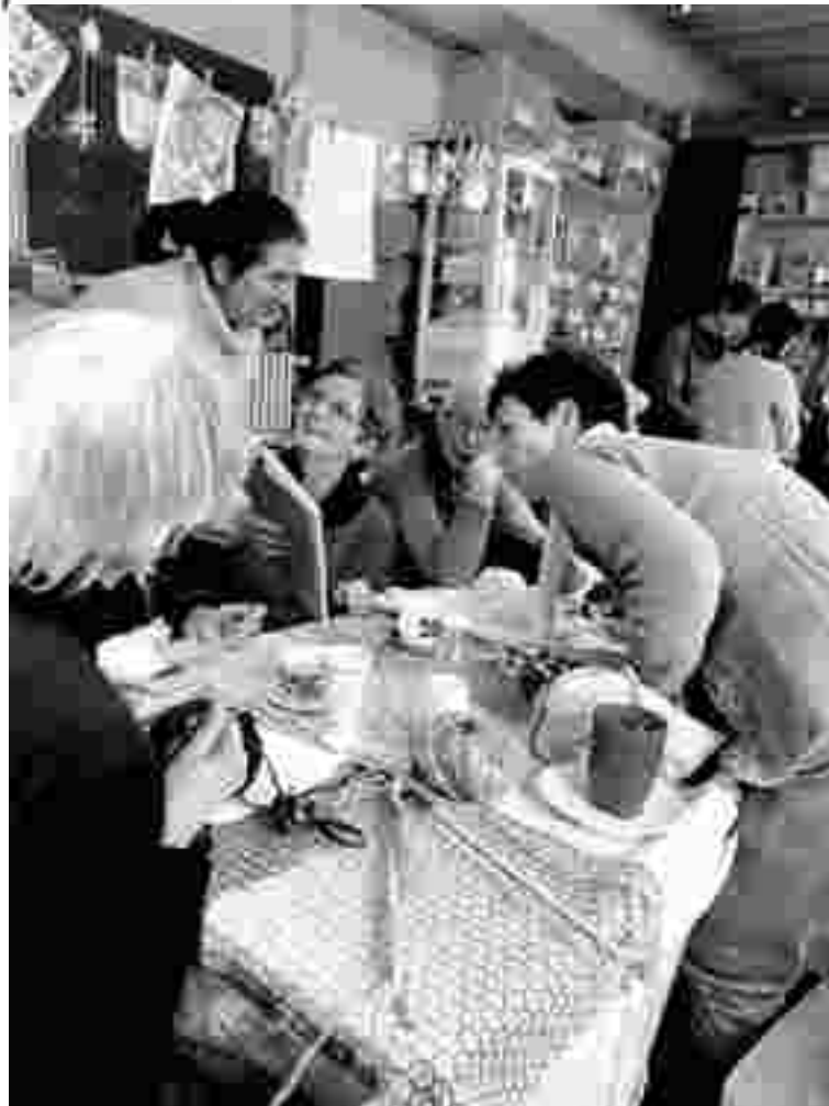
Les tricoteuses du café-tricot du vendredi après-midi.